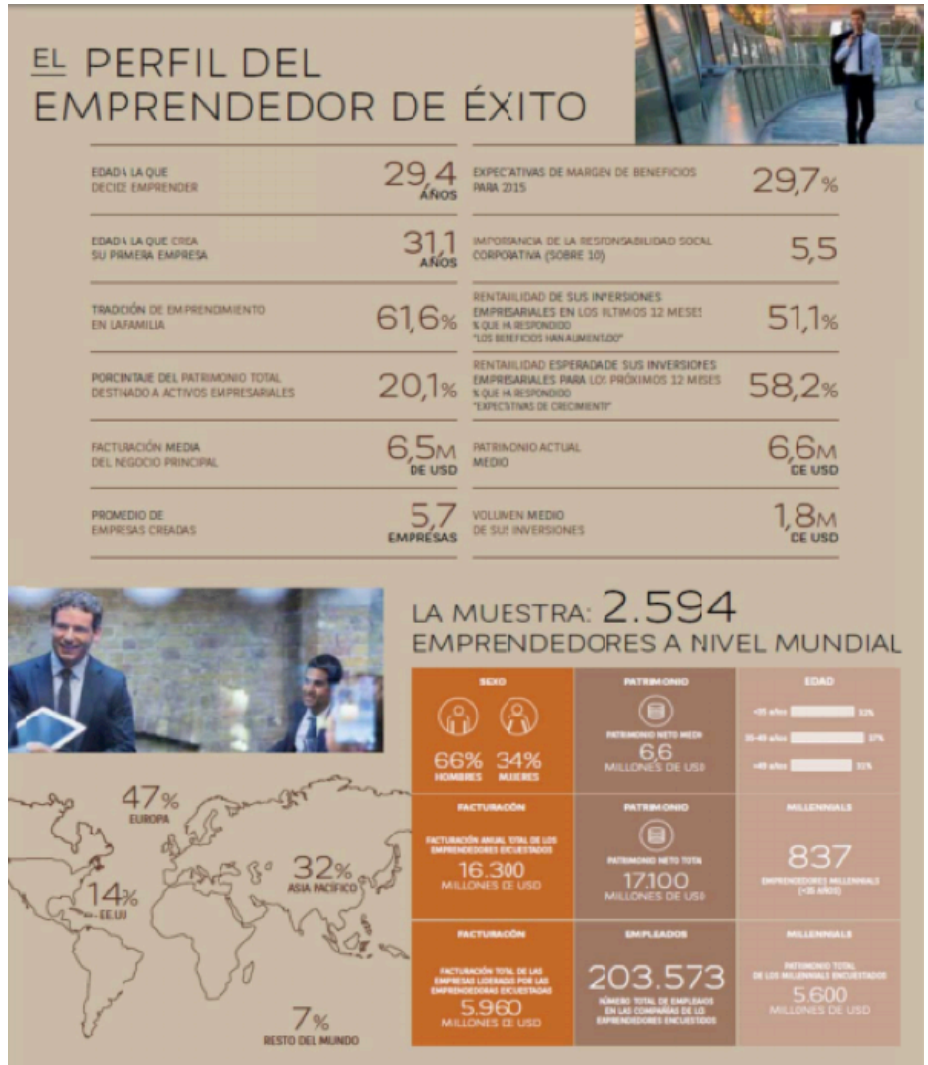
Infografía del Informe Global Sobre Emprendimiento BNP Paribas 2016 sobre el perfil del emprendedor de éxito.

El papel de la mujer como activo emprendedor juega un papel fundamental a la hora de tener actividad empresarial, ya que son éstas las que han tenido más éxito frente sus homólogos, debido en parte a su ambición profesional y su optimismo , pues el 89% de las mujeres encuestadas confían en que aumenten los beneficios de sus negocios en el próximo año . Por otro lado, los sectores con más proyección de futuro varían de posición, encon-